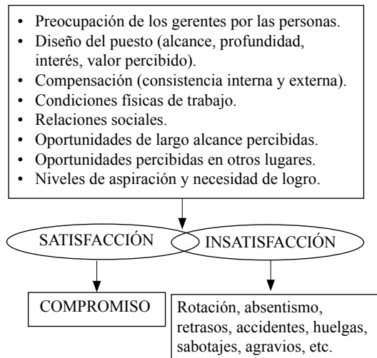
Figura 1. Factores de satisfacción laboral. Adaptación de Aziri (2011).

a estar satisfecha en su trabajo que aquella que conceda más valor a las cuestiones extrínsecas, como la remuneración más que al desempeño de un trabajo en el que se sienta bien. Otros factores como la familia en la que alguien crece o su cultura también se relacionan con la satisfacción que las personas experimentan en el trabajo (Ghazzawi, 2008).